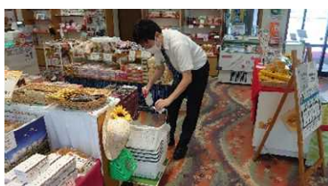
【売店接触部分の消毒】