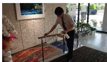
【玄関手すりの消毒】