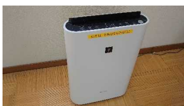
【浴場の空気清浄機】