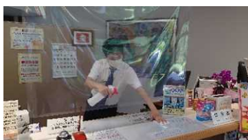
【フロントの定期的な消毒】