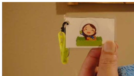
【客室、食事会場に自分用スリッパ