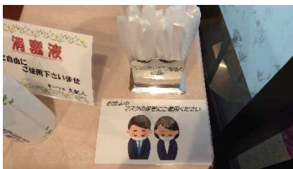
【食事会場にマスク保管袋設置】