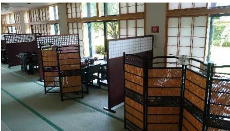
【食事会場での間隔を確保】

皆様には多大なるご迷惑をお掛け致しますが、何とぞご理解のほどよろしくお願い申し上げます。 今後ともあづま荘をよろしくお願い申し上げます。