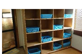
【脱衣かごの分散配置】